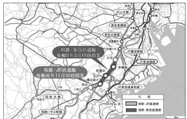
神奈川東部方面線路線図