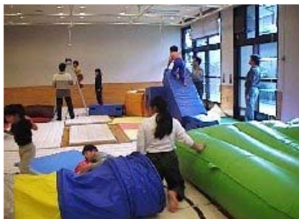
【地域療育センターにおける療育訓練の様子】