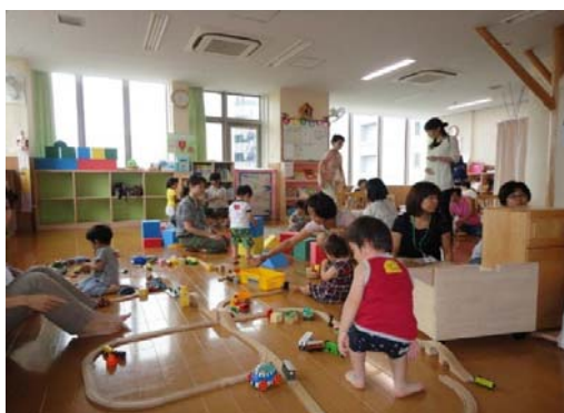
【地域子育て支援拠点】 （戸塚区・とつとの芽）