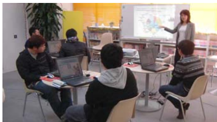
【地域ユースプラザの活動】