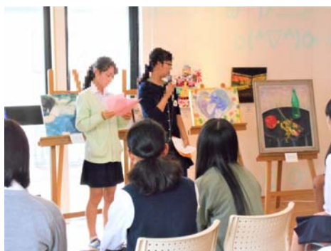
【青少年の地域活動拠点の活動】