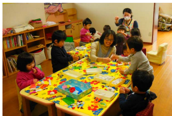
【乳幼児一時預かり事業】 （青葉区・子どもミニデイサービス まーぶる）