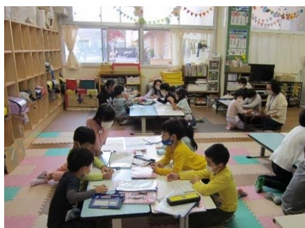
【放課後キッズクラブの活動】