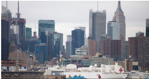
【横浜市米州事務所によるニューヨークにおける対応の現地レポート】

執筆者 toshikazuyazawa | 2020/5/27 | COVID-19