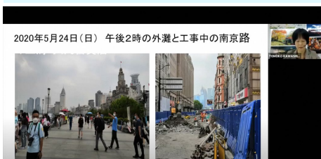
2020年5月24日(日) 午後2時の外灘と工事中の南京路

City of Yokohama Mumbai Representative Office has posted the first article in a series on its website about the impact of COVID-19 in India and Mumbai's response. It covers India's lockdown, the largest in the world, and how the country is endeavoring to lift the lockdown in stages.