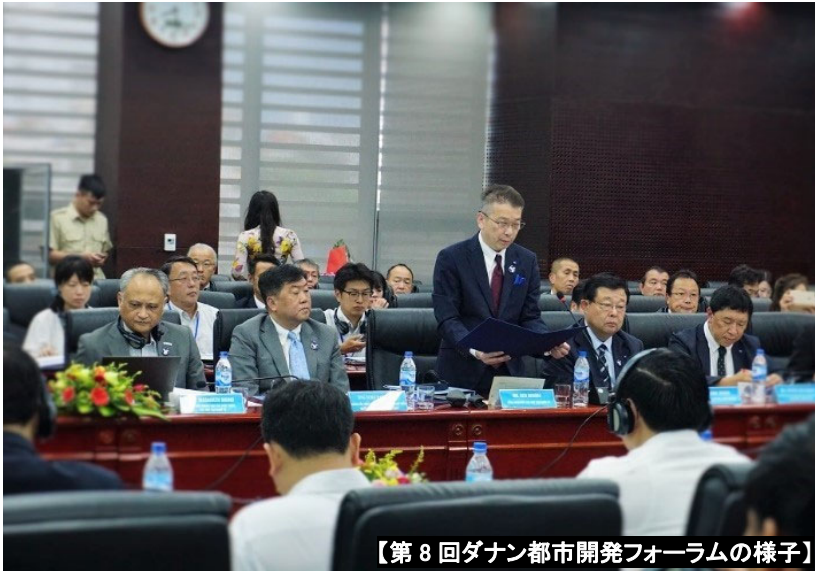
【第 8 回ダナン都市開発フォーラムの様子】

平成 30 年 9 月 10 日 【発行】横浜市国際局政策総務課 企画担当 045-671-4710 ki-somu@city.yokohama.jp