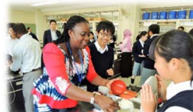
▲アフリカ各国研修での文化交流