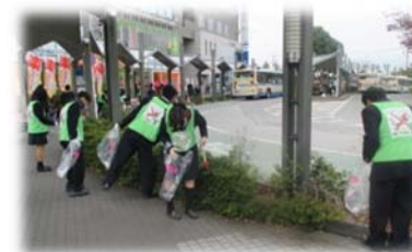
▲地域のごみ拾い活動