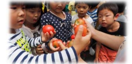
▲保育園児のトマトの収穫体験