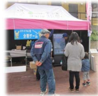
環境事業推進委員▶ の啓発活動