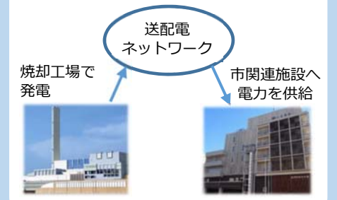
▲焼却工場で発電した電力の有効活用