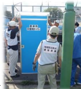
災害用 仮設トイレ▶