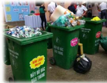
ベトナム・ダナン市での ごみ分別の デモンストレーション