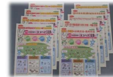
▲多言語のリーフレット