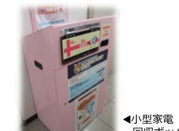
◀小型家電 回収ボックス