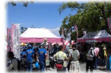
▲イベントでのブース出展