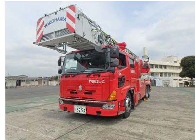
はしご付消防自動車