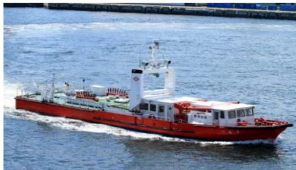
現行の消防艇「まもり」