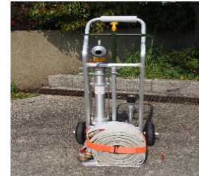
スタンドパイプ式初期消火器具