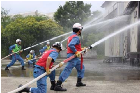
消防団放水活動訓練

消防訓練センターにおいて消防職員及び消防団員を対象として様々な教育訓練を実施し、専門的な知識・技術の修得及び向上を図るとともに、消防業務を円滑に遂行するために必要な資格者を養成します。 また、風水害等の災害対応力を強化するため、水難救助用訓練施設を改修するなど、教育に必要な訓練施設等を適切に維持管理します。