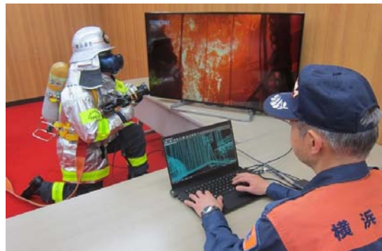
VR 消防教育システム

消防技術の科学化、効率化を図るため、火災原因調査に係る鑑識・鑑定を行うとともに、産学官連携により、VR消防教育システムの研究開発事業等を行うなど、消防の科学技術の更なる高度化を推進します。 また、火災や救急活動、建築物や危険物などに関する膨大なデータを一括管理し、施策立案に活用するためのシステム等について、利便性を向上させるとともに、定期的な保守・改良を行うことで安定した稼働を図ります。