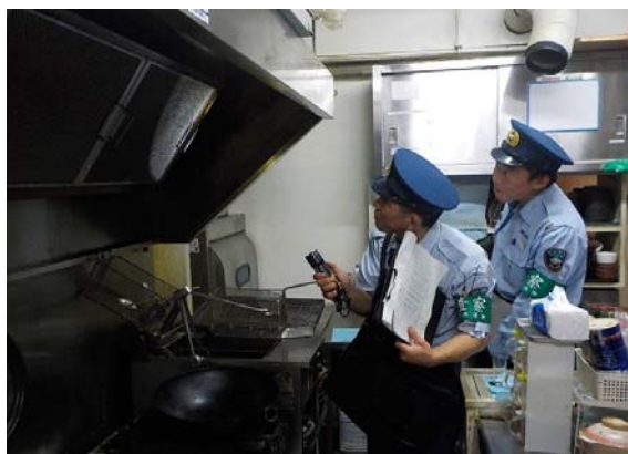
一 斉 夜 間 査 察

建築物や危険物、火薬類、高圧ガスを取り扱う施設等の安全性を確保し、火災等による被害を軽減するため、事前相談の段階から関係法令に基づく指導を行うとともに、計画的な立入検査や関係部局と連携した繁華街一斉夜間査察等を行い、違反の未然防止及び不備事項の是正指導に取り組みます。