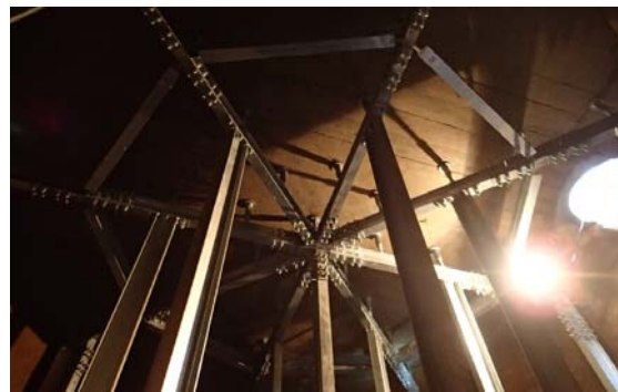
防火水槽補強工事