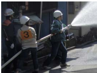
地域住民による初期消火訓練

また、初期消火器具等の取扱いに関する訓練などを実施し、地域防災力の向上に取り組みます。