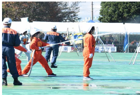
自 衛 消 防 隊 操 法 訓 練