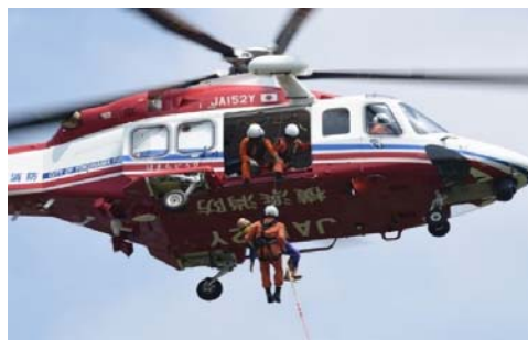
消防ヘリコプター

また、安全運航を維持していくため、航空機及びヘリポート等に係る施設・設備の適切な維持管理を行うとともに、新たに航空機保険に加入します。