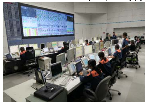
消防司令センター

年間約30万件の様々な災害通報（119番通報、FAX119通報、Net119緊急通報等）を確実に受信し、迅速かつ的確に対応するため、消防署所の老朽化した指令通信設備の更新や指令回線の保守等、消防通信指令システムの適切な維持管理を行います。