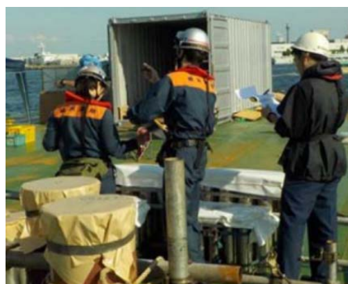
火 薬 類 検 査