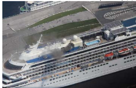
大型客船火災への対応状況

また、各消防署に設置している訓練施設を適切に維持管理するため、仮設訓練施設の点検・改修事業等を行います。