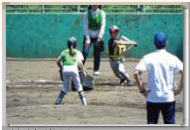
少年少女球技大会