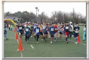
かるがもファミリーマラソン大会