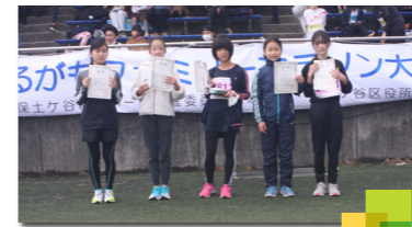
2km小学生女子入賞者