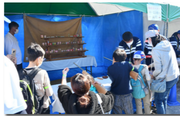
ほどがや区民まつり

※上記ほか、県・市スポーツ事業の補助動員、スポーツ推進委員大会等を予定しております。