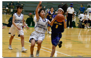
少年少女球技大会