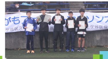
5km中学生男子入賞者