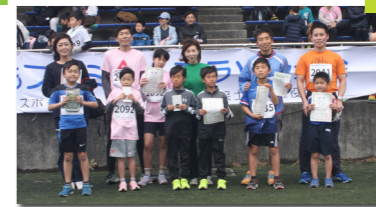
ファミリーA入賞者