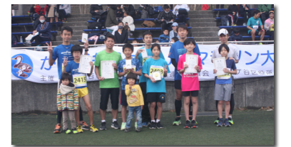
ファミリーB入賞者