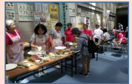
ヘルスマイトの皆さん

ヘルスマイトは、食生活等改善推進員セミナーを終了後、『私達の健康は私達の手で』を合言葉に自ら健康づくりを実践し、仲間や地域の人達とのふれあいを深めながら、栄養・運動・休養の調和のとれた健康づくりの活動を通して、活力ある地域社会づくりをめざしています。