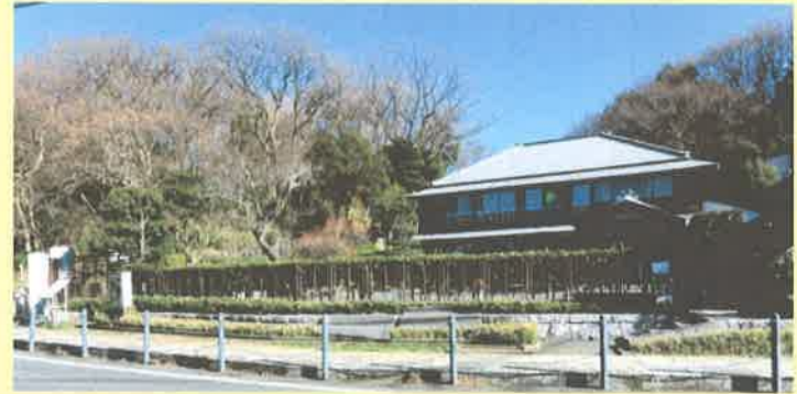
古民家 天王森公園「泉館」