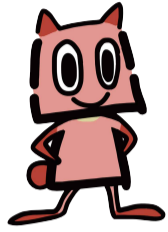
横浜市公園愛護会 マスコットキャラクター 「あいごぼん」