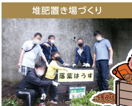
落ち葉の有効活用