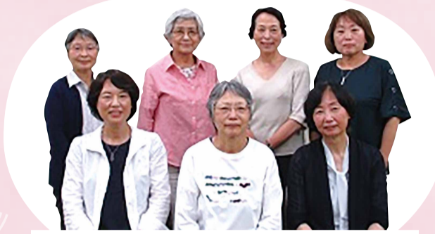
令和3年度 会長を中心とした役員の皆さん