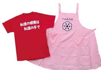
このTシャツとエプロンが活動時のトレードマークです!

新型コロナウイルス感染症の感染拡大防止のため、昨年度から調理実習や試食を伴う活動は中止していますが、工夫をしながら地域の皆さんに食を中心とした健康づくりを広めています。