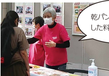
乾パンをアレンジした料理を説明中