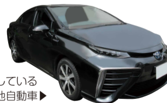
泉区公用車に使用している燃料電池自動車▶

泉区役所では、CO 2 削減効果の高い燃料電池自動車(FCV)を公用車として導入しています。燃料電池自動車は、水素を燃料として走る自動車です。走行時は、CO 2 などが発生せず、水のみを排出する環境にやさしい車です。