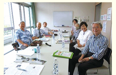
中田かわら版部会の編集メンバー

中田かわら版部会の編集メンバーも「新しいことを知ることができ、より地域のことがわかるようになった」と活動を楽しんでおり、今後はSDGsや環境問題などについても積極的に掲載し、若い世代にも読んでもらいたいと思いを一つにしています。(配布地区は中田地区のみです。)