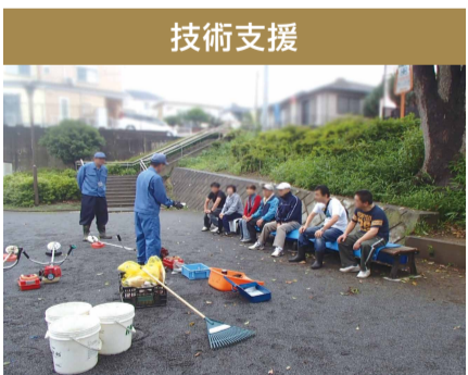
草刈り機の講習会