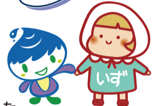
泉わくわくプラン 推進キャラクター 「いっずちゃん」

「泉が湧く」自然環境豊かな泉区で、「わくわく」しながら取り組むことで、誰もが安心して暮らせるまちを目指します。