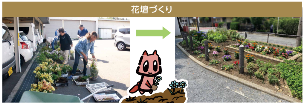
配布された花苗で...