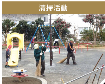
公園をいつもきれいに

泉区が管理している98公園のうち、92公園に公園愛護会があります。活動日や活動内容は各愛護会によって異なりますが、地域の皆さんが身近な公園を清潔に安全かつ楽しく利用できるように、みんなで頑張っています。