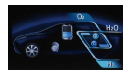
車内モニターの様子