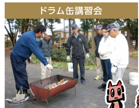
災害時に備えて火おこしの練習