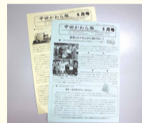
中田地区の情報紙「中田かわら版」

中田地区の情報紙「中田かわら版」は、平成19年6月に第1号を創刊以来、14年間休むことなく毎月発行し続けており、今月で第170号を迎えます。踊場地域ケアプラザが作成する「おどりば新聞」の面が「中田かわら版」になっている紙面は、読み応えのある内容になっています。