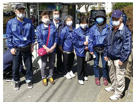
いちょう団地地区社会福祉協議会役員