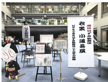
令和2年度開催の様子

公演で使用する衣裳・小道具の展示 その他、泉伝統文化保存会(太鼓お囃子・ 凧)に関する動画放映やパネル展示など 10月4日(月)～8日(金) 区役所1階区民ホールで 区民事業担当 ☎800-2392 fax 800-2507