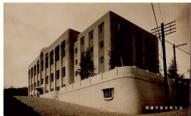
昭和2年に現在の中央図書館と同じ場所に竣工した横浜市図書館「デジタルアーカイブ都市横浜の記憶」より

泉図書館では、9月17日(金)～26日(日)に、図書館の100年を振り返るパネル展「横浜市立図書館100年のあゆみ」を開催します。図書館のこれまでをご覧いただき、これからの100年にご期待ください。