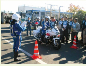
過年度講習会の様子▶