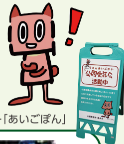
横浜市公園愛護会 マスコットキャラクター「あいごぼん」