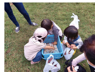
子育てサロン活動(お芋掘り)