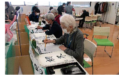
お出かけカフェの活動の様子