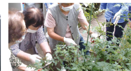
ベルガーデン水曜クラブ