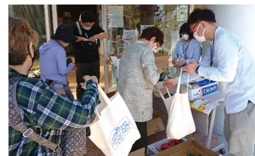
新橋地域ケアプラザ

買い物のサポートだけでなく、地域の見守り、ふれあいの場にもなっています。ぜひ足を運んでみてください。