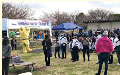
過去の開会式の様子

ヨコハマ3R夢!プランや脱温暖化に関するパネル展示のほか、施設内見学も兼ねたウォーキングなどを通じて、子どもから大人まで楽しみながら環境問題について理解を深められるイベントです。