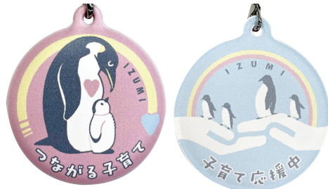
表と裏でデザインが違います

皆さんで「子育て応援マーク」を身に付けて、声を掛け合い、地域でのつながりを深めましょう。