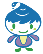
泉区マスコットキャラクター「いっずん」