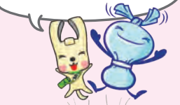
「ヨコハマ3R夢」マスコット イーオ ヘラ星人 ミーオ