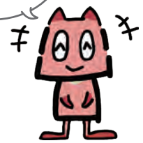
横浜市公園愛護会PRキャラクター あいごぼん