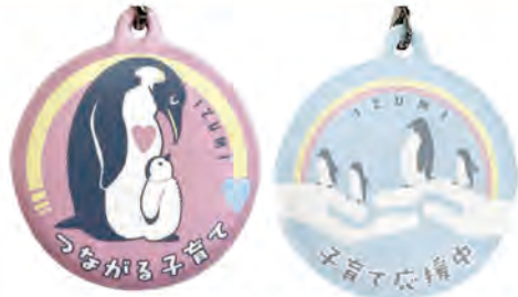
表と裏でデザインが違います

皆さんで「子育て応援マーク」を身に付けて、声を掛け合い、地域でのつながりを深めましょう。