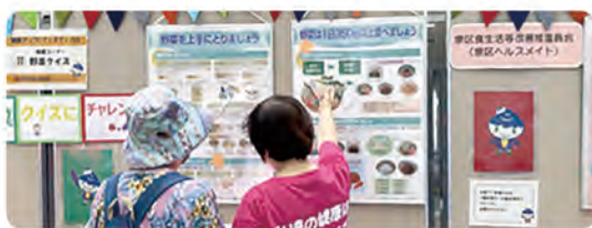
野菜クイズで1日の野菜摂取量を啓発

現在は調理実習や試食を伴う活動は中止していますが、6月に開催した健康づくりイベントで、野菜摂取を啓発する動画を紹介しました。