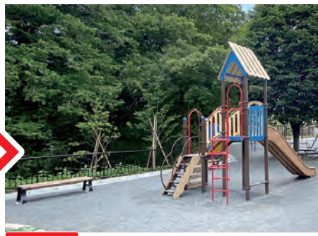
工事後 遊具やベンチ、防球ネットなど全面的に新しくなりました。