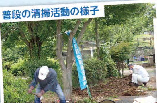
普段の清掃活動の様子