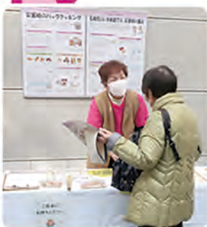
「災害時の食事について」啓発