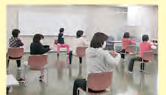
▲昨年の講座の様子

☎ 800-2445 fax 800-2516 ✉ iz-kenko@city.yokohama.jp(件名に「ヘルスマイト養成講座申込み」と明記)