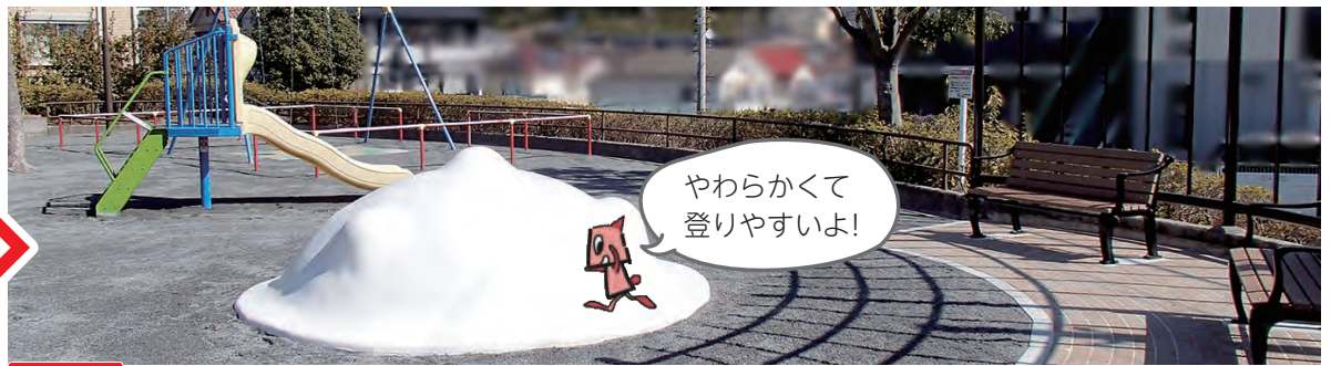
工事後 砂場が撤去され登れる遊具になりました。また、舗装などもきれいになりました。