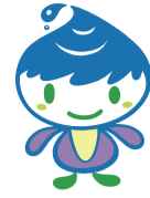
泉区マスコットキャラクター「いづん」