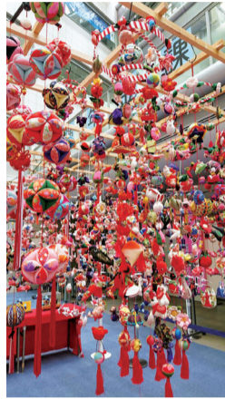
昨年の展示の様子