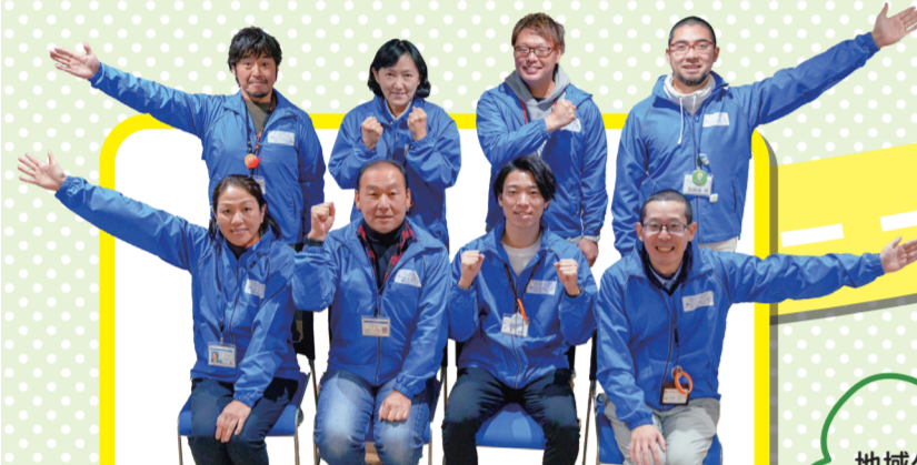
生活支援コーディネーターの皆さん