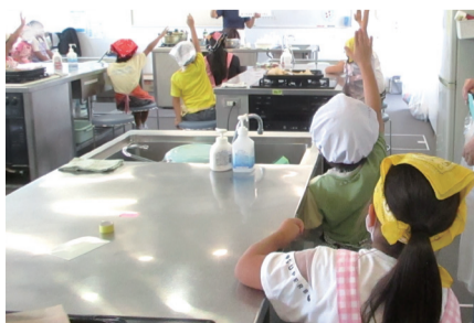
子どもたちが参加するピザ講座