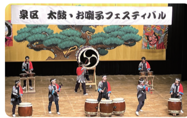
泉郷土芸能保存会(太鼓・お囃子)