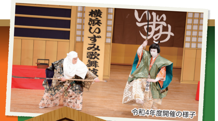
令和4年度開催の様子