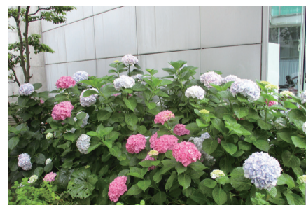
ボランティアの皆さんがお手入れした中庭のお花

問 下和泉地域ケアプラザ ☎ 802-9920 fax 802-9927 / 事業企画担当 ☎ 800-2433 fax 800-2516