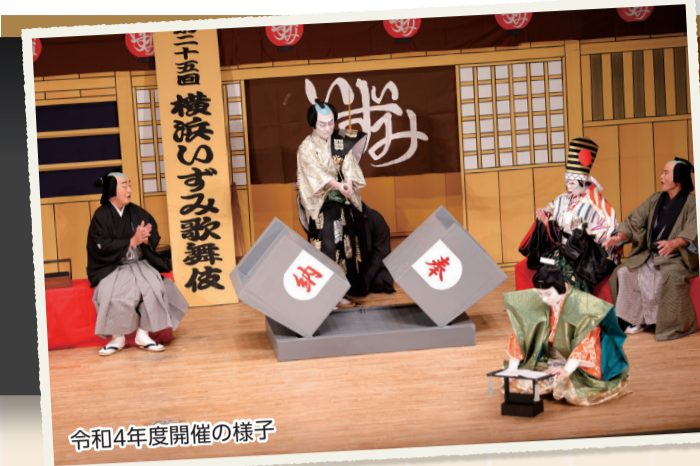
令和4年度開催の様子

泉区の秋の風物詩として区民の皆さんに親しまれている「横浜いずみ歌舞伎」の季節がやってくる! 今年も見どころ満載の人気演目をお楽しみいただけます。泉区の伝統文化を知り、10月の公演に足を運んでみませんか?