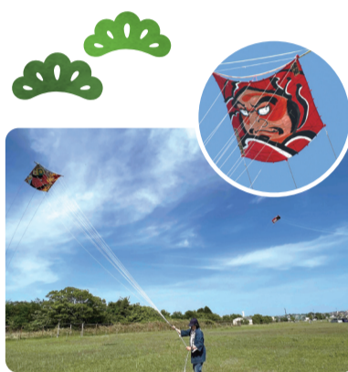
相模風いずみ保存会

泉区では、横浜いずみ歌舞伎保存会のほか、泉郷土芸能保存会、相模風いずみ保存会が「泉伝統文化保存会」として活動しています。 どの保存会も、一緒に活動する仲間を募集中です! 興味のある人は、地域振興課区民事業担当までお問い合わせください。 伝統文化を支えているのは、区民の皆さんです!!