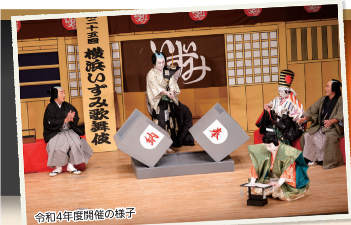
令和4年度開催の様子