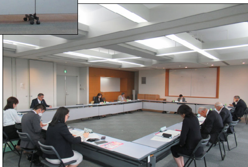
▲定例委員会の様子

定例委員会で承認された今年度の事業計画について次ページ以降に掲載していますので、ぜひご覧ください。