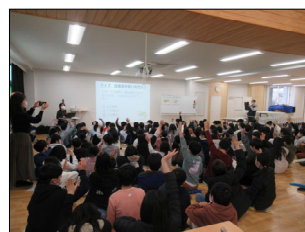
▲令和5年度実施の様子