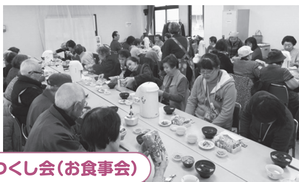
つくし会(お食事会)

今後は、地域をあげて相互に連携し、世代間の交流の機会やつながりを一層広げるとともに、新しい担い手が登場しやすいきっかけをつくっていきます。また、地域の特性にあった安心して暮らせるまちづくりを目指していきます。