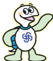
神奈川県マスコットキャラクター かめ太郎