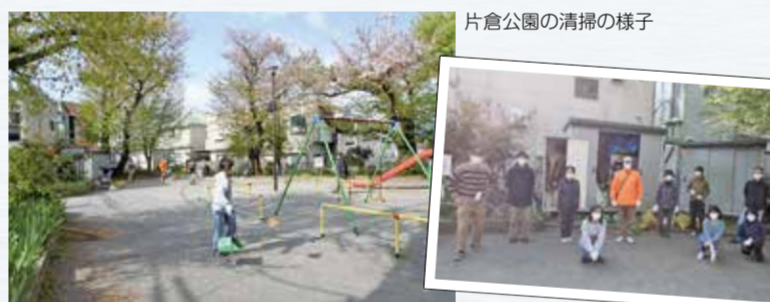
片倉公園の清掃の様子

毎月第2・3・4土曜日に町内会の班ごとの当番制で、片倉公園を中心に地域清掃を継続的に行っています。自由参加も歓迎です。安心快適に公園が利用できるよう、定期的に遊具の点検を行い、砂場の清掃も実施しています。