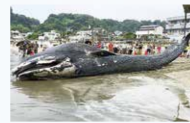
漂着したシロナガスクジラの胃から、プラスチックごみであるナイロン片などが発見されました(神奈川県鎌倉市)

これは、ジャンボジェット機約5万機分の重さ(環境省ホームページ)ともいわれています。不法投棄やポイ捨て、屋外にあるプラスチック製品の劣化などが原因と考えられています。プラスチックごみは自然界で分解されにくいこともあり、このままだと2050年までに魚の重量を上回る量のプラスチックごみが海洋を占めると予測されています。