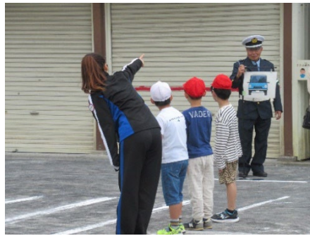
はまっ子交通あんぜん教室