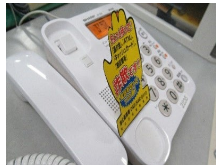
特殊詐欺防止・電話機用ポップ