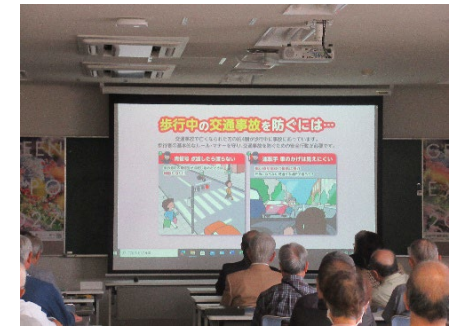
シルバーリーダー連絡協議会総会