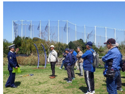
高齢者 ウォークラリー