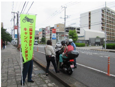
交通安全キャンペーン