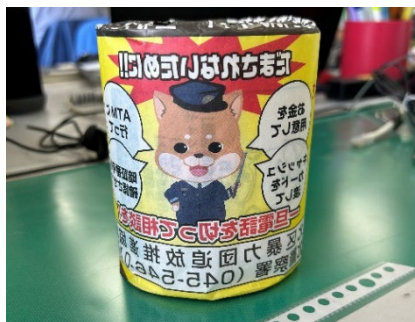
特殊詐欺注意喚起 トイレトペーパー