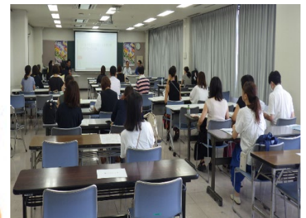
子ども110番の家 ネットワーク会議