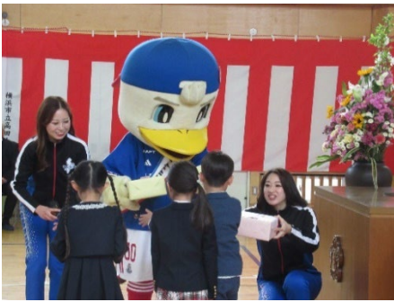
ランドセルカバー贈呈式