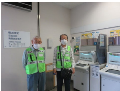
港北区振り込め詐欺防止 ATM声掛け隊