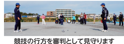
競技の行方を審判として見守ります