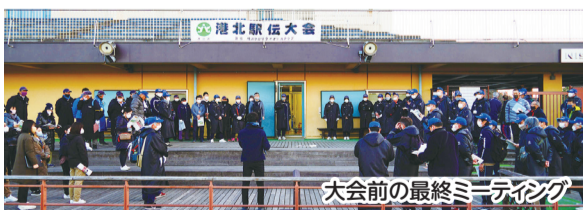
大会前の最終ミーティング