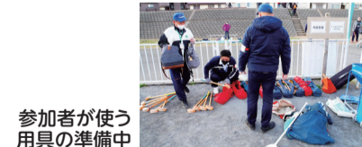
参加者が使う用具の準備中