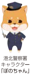
港北警察署キャラクター「ほのちゃん」

被害者の約95パーセントは「自分は大丈夫」と思っていました。迷惑電話防止機能付き電話機等で、犯人からの電話をブロックすることが被害防止への第一歩です。