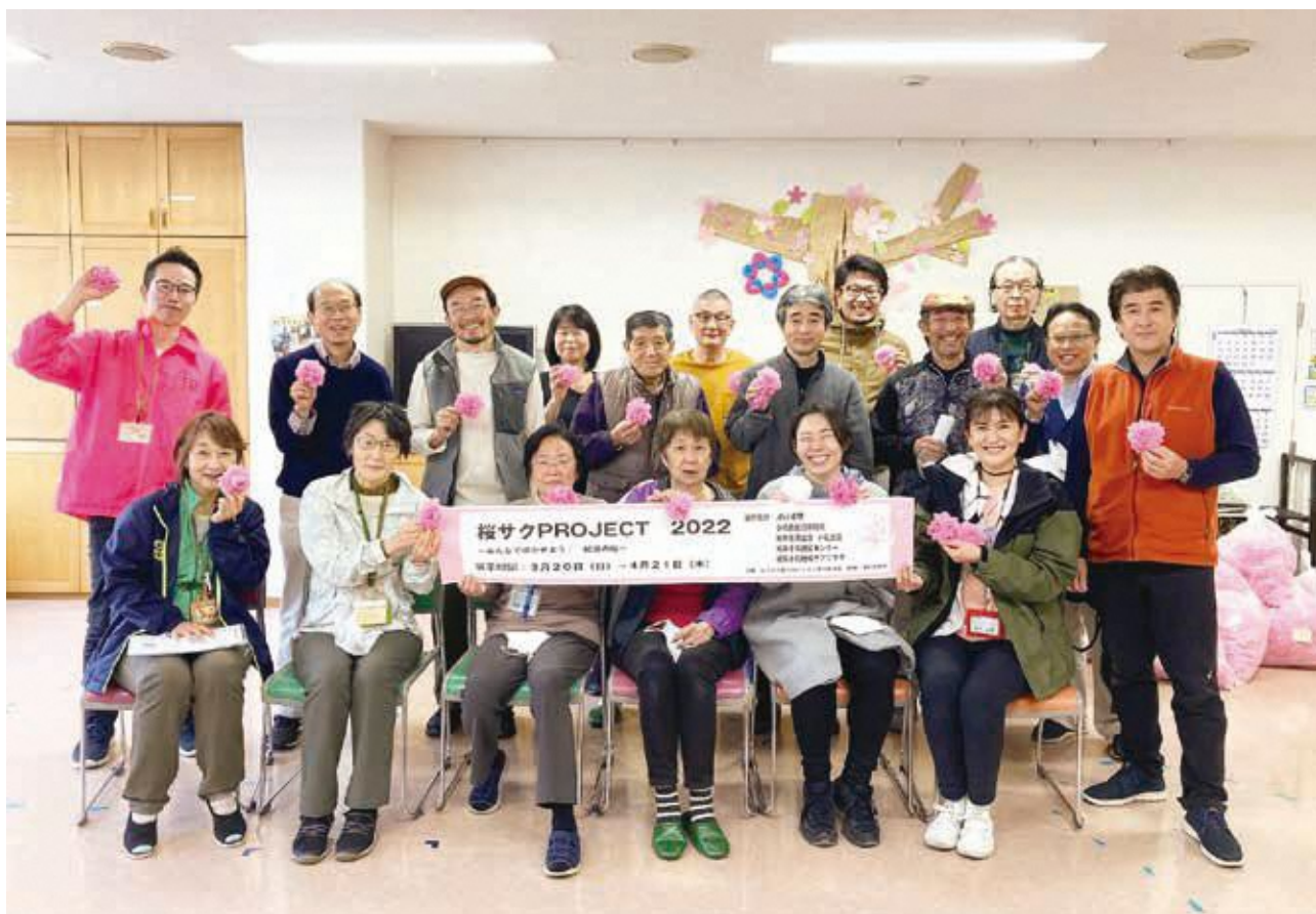
(しろさと絆プロジェクト実行委員会の皆さん)