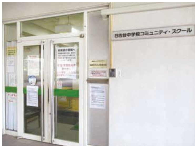
日吉台中学校コミュニティスクール入口

住所:横浜市港北区日吉本町4-9-1 電話:045-565-2840 FAX:045-565-2840 開館時間:日・月・水・木・土曜日 9時～21時 休館日:毎週火・金曜日 年末年始(12月29日～1月3日) 交通:市営地下鉄グリーンライン「日吉本町駅」 下車 徒歩7分 バス停:「日吉台中学校」下車