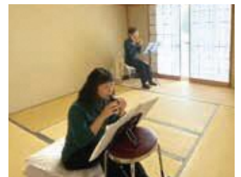
オカリナ合奏の様子

縦笛でもなく、フルートでもない、何とも言えないオカリナの音色もまた趣きがあり心に染み入ってきます。「埴生の宿」や「見上げてごらん夜の星を」、「峠の我が家」といったオカリナ向きの曲