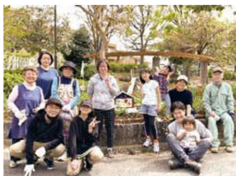
「師岡打越第三公園愛護会」の皆さん