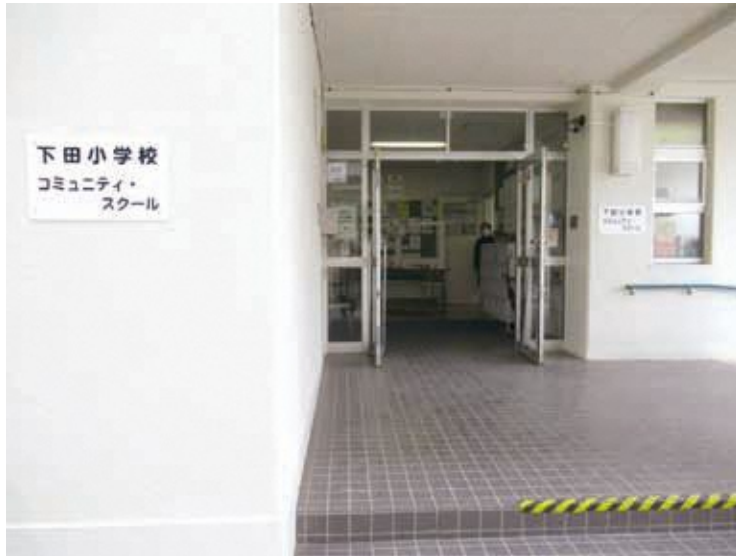
下田小学校コミュニティスクール入口

下田小学校の正門から、まっすぐ校庭に続く通路を歩いていくと、校舎の一角に下田小学校コミュニティスクールの入口が見えます。太極拳、体操、ピラティス、日本舞踊、書道、水彩画、絵手紙、パッチワークや生け花など、運動系、文化系の多種多様なジャンルのサークルが活動しています。今回は、気功太極拳とオカリナサークルの活動取材しました。