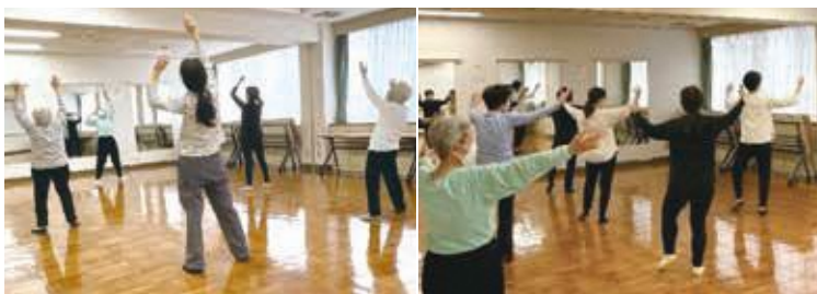
1部(左)と2部(右) 気功太極拳

全身を使い、ゆったりと流れるような動きを繰り返す気功太極拳。私も見よう見まねで体験してみましたが、身体全体が温かくなっていくのを感じました。子育てが一段落したのをきっかけに始めた方、親子三代で続けている方、90代の方は「自分のペースでできるから続けられている。」とおっしゃっていました。「心落ち着く場所がほしかった。」という言葉通り、心身ともに整った気持ちになれる活動です。