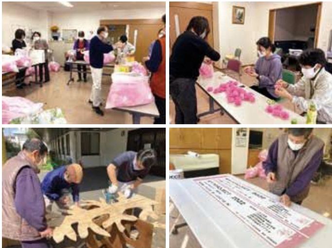
桜サクPROJECT2022展示準備の様子

この春の「桜サクPROJECT2022～みんなで咲かせよう！城郷の桜～」には、町内会、地域活動団体、幼保、小中高、福祉施設や高齢者施設など、40を超える協力団体が参加。薄紙を使いみんなで折った桜が、小机駅と城郷地区5会場に飾られ、明るい春をもたらしてくれました。