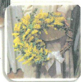
写真はイメージで、 季節の素材を使用します