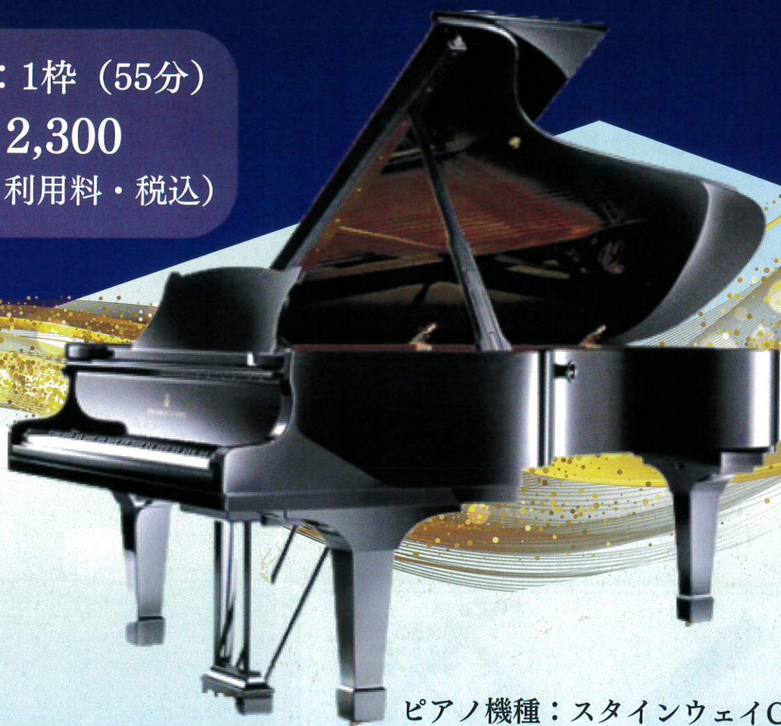
ピアノ機種：スタインウェイC-227

会場 フォーラム(男女共同参画センター横浜) ホール 実施日時 2025年4月～2026年3月 火・水・木曜日の夜間(祝日・休館日は除く) ①18:00～18:55 ※開催日はお問い合わせください。 ②19:00～19:55 ※1時間の内5分を入替時間とします。 ③20:00～20:55 ※1人3枠まで、同日は2枠まで予約可。 申込方法 利用日の2ヵ月前の1日より、電話・来館にて先着順受付 電話:045-862-5024 (受付時間:平日10:00～20:00・日祝10:00～16:00) 料金支払 利用当日に現金支払い