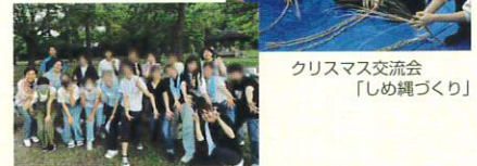
クリスマス交流会 「しめ縄づくり」