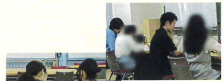
学習支援「まなびれっじ」

A君は、今の時点でやってみたい事があって、それはとても良いことだと思います。これからの高校生活や大学を調べることを通して、進路が明確になりました。やりたい事が変わったりすることもあります。ぜひ色々悩みながら、高校生活を楽しくしてください！いつでも進路や留学の事を相談してください。勉強はコツコツやっていけばなんとかなります。頑張ってくださいね！また、「まなびれっじ」で会えるのを楽しみにしています。