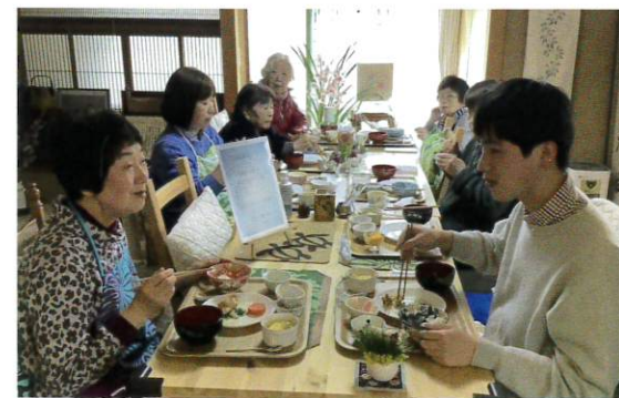
家族介護者（ケアラー）のための開かれた 情報交換の場を住み開きで提供する活動 (ケアラーズカフェモンスター)