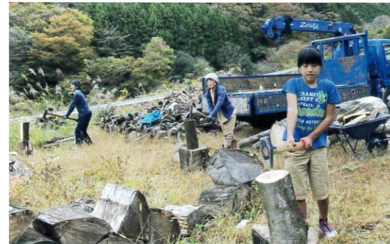
木質バイオマスを活用した 地域内エコシステム構築事業 (特定非営利活動法人 仝(ろく))