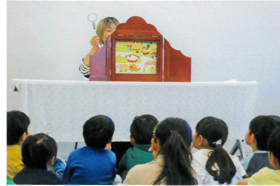
保育園における食物アレルギー 事故発生防止事業 (NPO 法人 ピアサポート F.A.cafe)