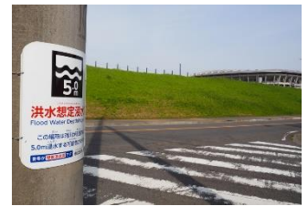
日産スタジアムにも近い小机地区では最大5.1mを想定

港北区は3月、新羽地区と城郷地区(小机・鳥山・岸根)に各50カ所ずつ計100カ所で河川が氾濫した場合の最大想定浸水の深さを記した電柱巻付け看板「まるごとまちごとハザードマップ」を設置し、水害への備えを呼び掛けています。