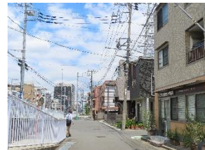
日吉4丁目・綱島街道沿いにある

出身地である菊名・妙蓮寺や大倉山、そして現在も在住する日吉近郊での企業や人的ネットワークもさらに広がっているとのことで、「地域の身近な相談所として、ぜひお気軽にお立ち寄りください」と、「いざ」という際にも、自身や事務所を“頼れる”事務所としての発展を志していく考えです。