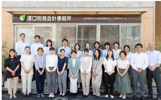
「澤口税務会計事務所」の社員・スタッフは20人体制に増員している (公式サイト: https://sawazeirishi.com/ )

1980(昭和55)年神奈川県松見町生まれ。高校在学時までを菊名や大倉山周辺の港北区内で過ごす。中央大学法学部卒。2015年7月澤口税務会計事務所を開所。港北区日吉エリアを拠点に税理士活動を行うほか、セミナーなどの講師としても登壇。2023年2月までに事務所をリニューアル拡張、事務所の代表者として運営も行う。元野球少年、実家は大倉山。