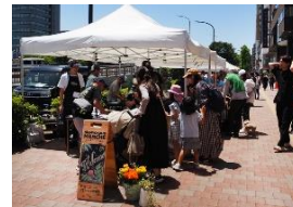
「シノコハマルシェ」を初開催

同町内会では今年30回の記念開催となる秋の恒例イベント「新横浜パフォーマンス」で駅開業60年を記念する企画も行う予定。