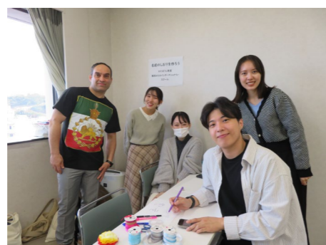
▲わたぼうし教室 & 横濱みなみインターナショナル・スクール 「多言語で名前の書き方を伝え、しおり作りをしました。」