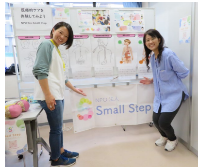
▲NPO法人 Small Step 「医療的ケアについて、多くの人に知ってもらえました。」

「みんなの『わっ!』フェスタ」は、年1度の大きなフェスタで、市民活動団体・街の先生・多文化共生ボランティアなど、多様な言語や文化をもつ人たちによって作り上げられています。今回は参加団体からの一言を紹介し、フェスタで出会った「市民活動団体を紹介してほしい!」「イベントに呼びたい!」などの要望がありましたら、お気軽にみなみラウンジにご連絡ください。