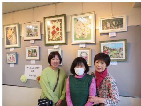
▲遊花の会 「色とりどりの押し花で、しおり作り体験をしていただきました。」