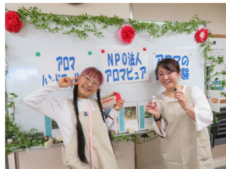
▲NPO法人 アロマピュア 「香りとハンドマッサージで癒やしの時間を提供しました。」