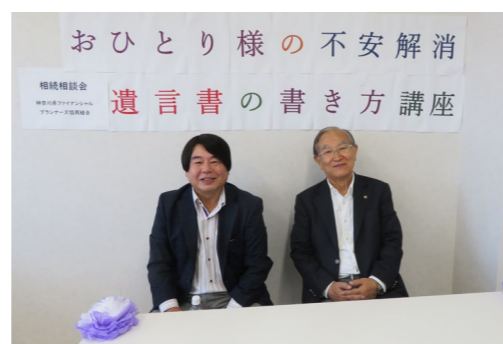
▲神奈川県ファイナンシャルプランナーズ協同組合 「遺言書の大切さを伝えました。」