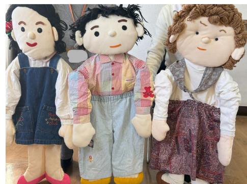
▲就学前ワークショップ人形劇の様子

特定非営利活動法人CAPかながわ お問い合わせ capkanagawa2016@yahoo.co.jp