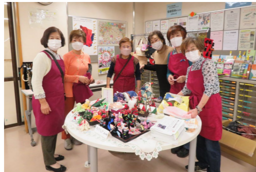
▲特定非営利活動法人 WE21 ジャパン 「フェアトレードのしょうがパウダーのお茶がとても人気でした。」