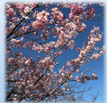
過去の蒔田公園周辺の桜

イベントは天候などの諸事情によりスケジュールの変更や中止になる場合がございます。あらかじめご了承ください。