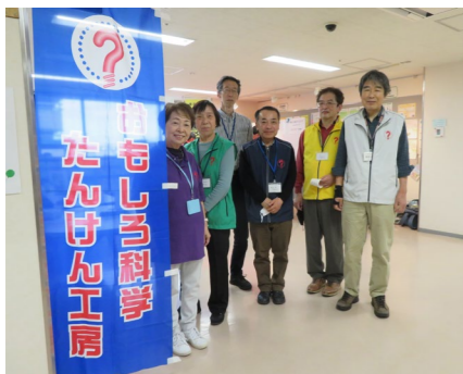
▲認定NPO法人 おもしろ科学たんけん工房 「面白くて簡単な『ネコひやくめんそう』作りは、紙コップ2個を重ね、ネコの目を入れました。」