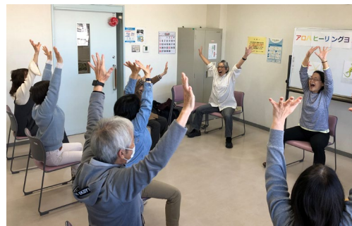
▲アロハ・ヒーリング・ヨガの様子

CAPかながわでは、多くのこどもやおとなにCAPプログラムを伝えるスタッフを募集しています。私たちと一緒に活動をしてみませんか？CAPの活動を行うには、規定の講座を受講することが必要になります。ぜひお問い合わせください。