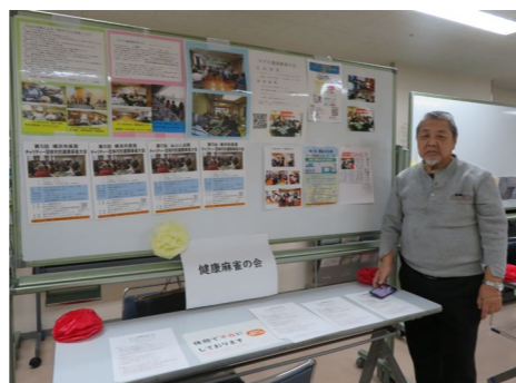
▲NPO法人 健康麻雀の会 「健康麻雀は認知症予防と青少年の能力開発に役立ちます。」

今回ご紹介した市民活動団体の詳細を知りたい方、右の二次元からご覧ください。その他にもスポーツ・福祉・まちづくり・IT関連などの団体がみなみラウンジに登録しています。