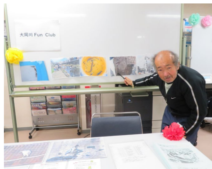
▲大岡川 Fun Club 「大岡川の自然観察などを通して、世代間交流や地域交流を交えての活動を紹介しました。」