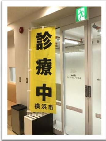
港南台レディースクリニック