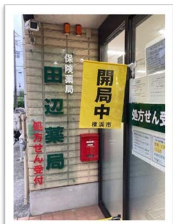
田辺薬局 港南中央店