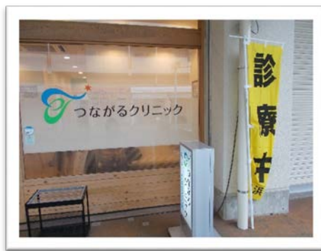
つながるクリニック