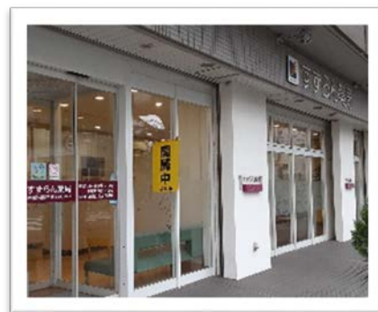
サン薬局 すずらん薬局