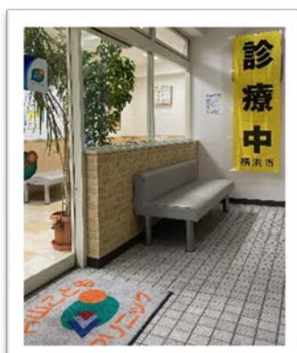
片山こどもクリニック