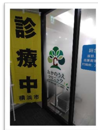
おかのうえクリニック