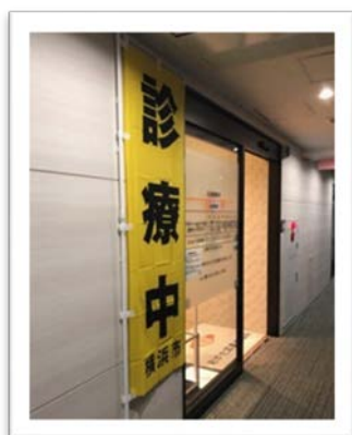
おがた耳鼻咽喉科