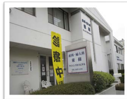
東條ウイメンズホスピタル