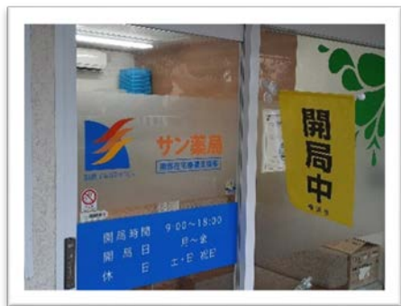
サン薬局南部在宅療養支援部