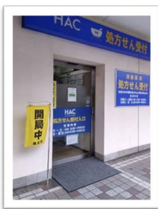
ハックドラッグ港南台バース

今回の訓練では 25 の医療機関 から画像提供 いただきました。 ご協力いただき、 ありがとうございました。