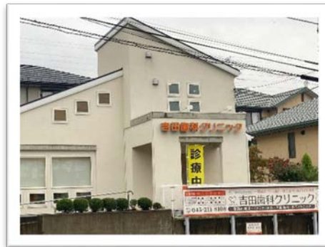
吉田歯科クリニック