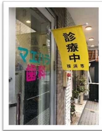
マエハラ歯科医院