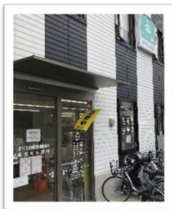
そうごう薬局 芹が谷店