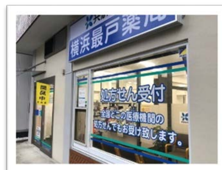
共創未来横浜最戸薬局