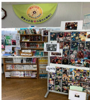
『呪術廻戦/鬼滅の刃/MAO』