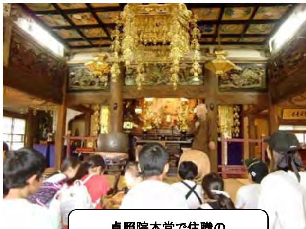
貞照院本堂で住職の 話を聞きました。