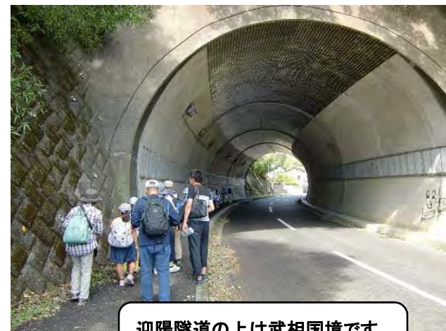
迎陽隧道の上は武相国境です。 たくさんの句が生まれました。