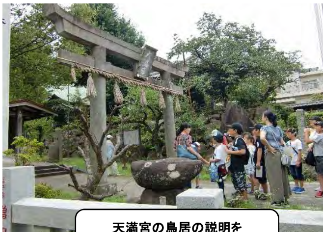
天満宮の鳥居の説明を 聞く参加者。