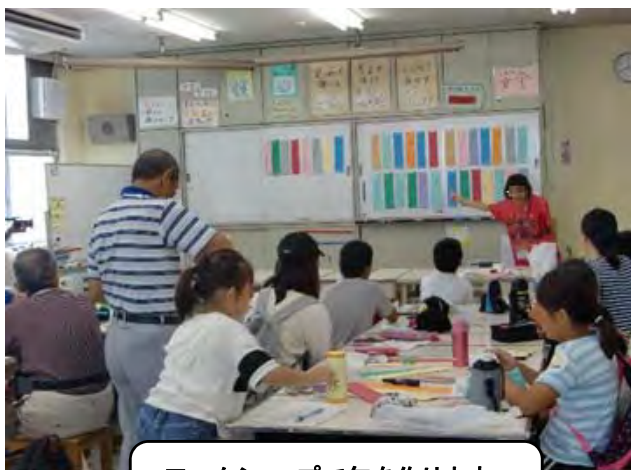
ワークショップで句を作ります。 沢山の句ができています。