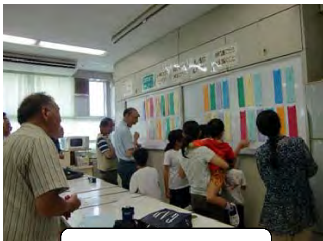
好きな句にシールを貼ります。