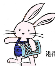
港南図書館マスコットキャラクター こうなんうさぼん

認知症の専門医が認知症当事者になってわかったことを伝えます。認知症の診断をする物差しである認知機能検査「長谷川式スケール」を開発し、「痴呆」から「認知症」への呼称変更に関する国の検討委員も務めた著者が、認知症の基礎知識から歴史、社会、医療についても語っています。