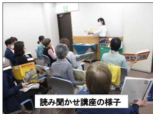
読み聞かせ講座の様子