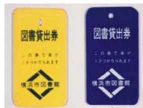
トークン(移動図書館で使用)