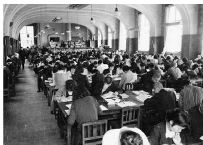
横浜市図書館閲覧室(昭和35年)