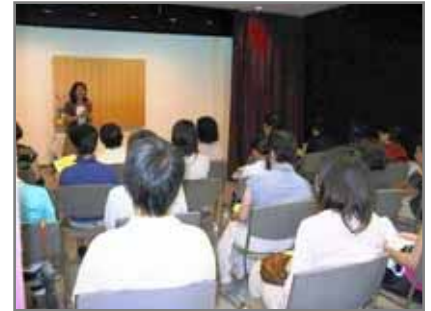
【山内図書館】大人のためのおはなし会