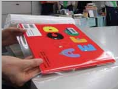
しわが寄らないように... 「フィルムコーティング」は熟練のいる作業です

そして、「バーコード」を貼り、図書館システムに登録をします。次に、本棚での場所を示す「分類ラベル」を印刷して貼り、続いて、「図書館名ラベル」や、館内での場所を示す「別置シール」を貼ります。そして、「地印」(各図書館名と受け入れた年が表示された印)を押して、最後に、長い間多くの人に読まれても痛みにくいように「フィルムコーティング」で補強をして、装備が完了します。