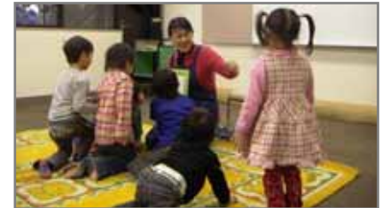
【中図書館】定例おはなし会