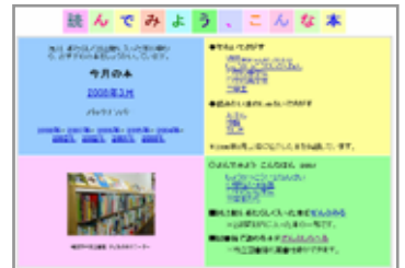
「読んでみよう、こんな本」(市立図書館ホームページ)

全市立図書館 「読んでみよう こんな本」 (期間) 4/1(火)~6/30(月) (会場) 市立図書館18館 (内容) 市立図書館ホームページ「読んでみよう、こんな本」で紹介している児童書を展示します。