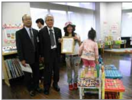
【中央図書館1階児童コーナー】 5月5日 感謝状贈呈式を行いました