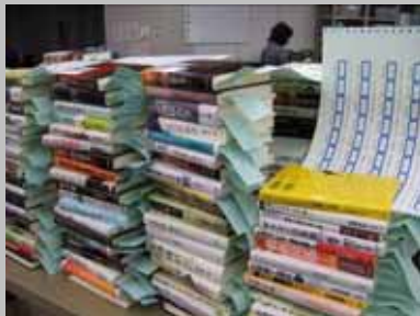
「分類ラベル」を印刷しました

装備室に持ち込まれる資料には全て、装備方法が指示された「短冊」が挟まれています。まず、「短冊」と資料が合っているか検品をします。