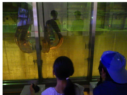
ごみクレーン操作体験