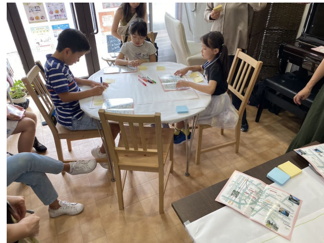
会長の講演を聞きながらポイントをメモ