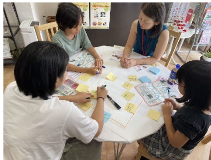
大人を交えてディスカッション