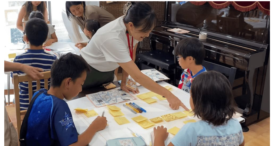
商店会役員と共に企画のブラッシュアップ

学年の違う子どもたちが仲良くグループワークに取り組んでいる様子を見ると、学校でも年の違う子たちの交流がもっとしやすい環境を作れたら良いと思いました。