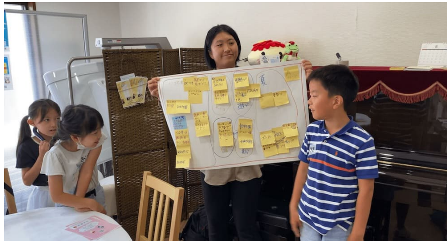
学生サポーターと一緒に企画案の発表

実際に自分自身や子供達がコミュニティづくりに関わる良い機会となりました。子供達とアイデア出しをする時には、小学生ならではの視点を聞くことができ、普段の自分とは違う新たな発見が多くありました。素敵な機会の良い学びをさせていただきました。