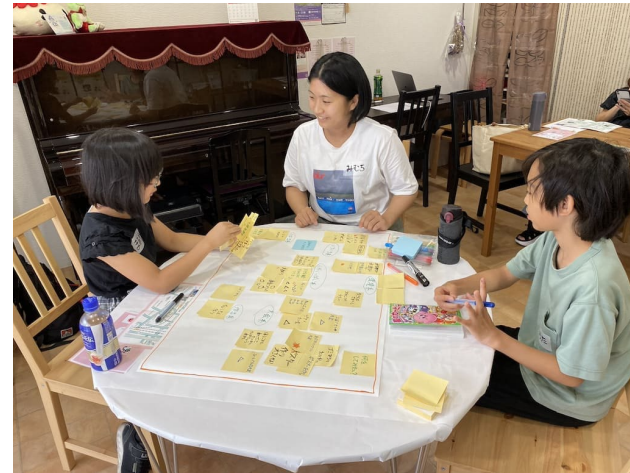
たくさん出たアイデアを整理中