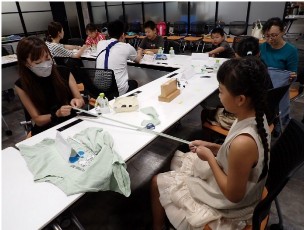
ワークショップ中の様子

ワークショップには保護者の方にも参加していただきました。そのお陰もあり、3年生からでもみんな楽しく体験していただきました！最初にちょっとお手伝いをするだけでみんなすらすらと作成できていて来年度はもっと参加人数を増やし、たくさんの子ども達に参加してもらいたいと思っています。