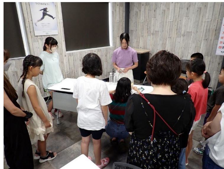
ワークショップの説明の様子