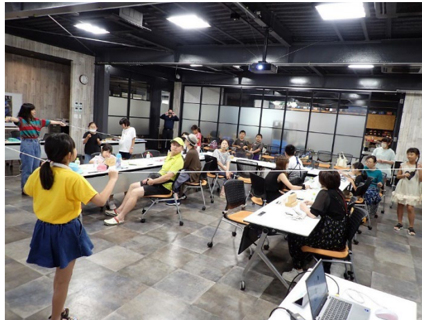
ワークショップで使用する 紐の作成の様子