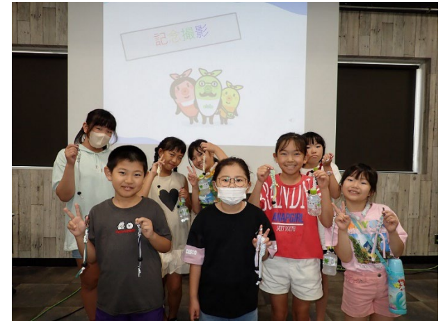
作成した作品の紹介