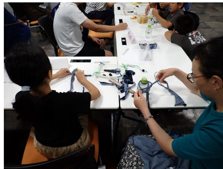
ワークショップ中の様子