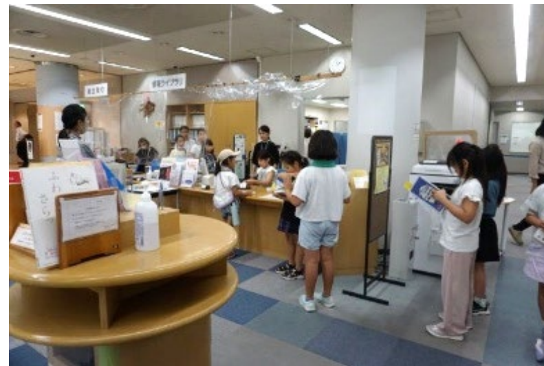
図書カウンターでの貸出と返却作業を教えている様子