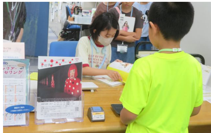
本の貸出と返却作業を行っている様子