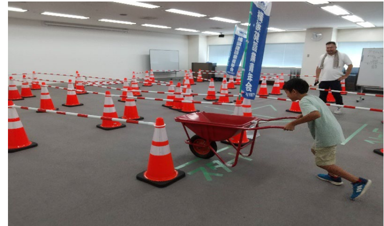
一輪車の運搬作業でタイムを競う様子