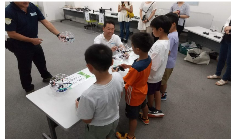
ドローン操作の説明を受ける様子