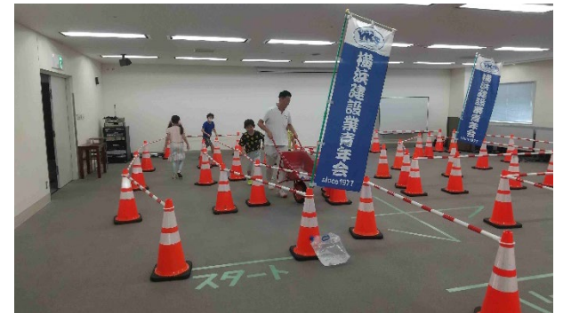
一輪車の運搬作業をレクチャーする様子