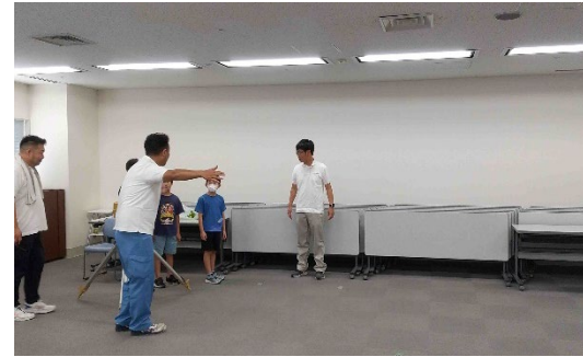
体を使った測量方法を教える様子