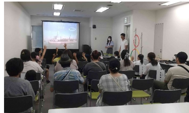
学生サポーターによる振り返り会の様子