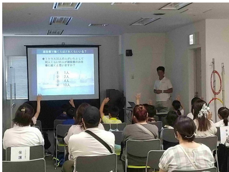
クイズに積極的に答える様子