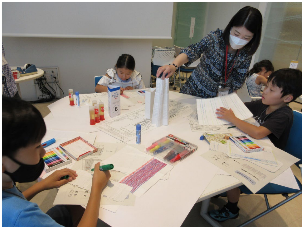
ペーパークラフトを組み立てる子どもたち