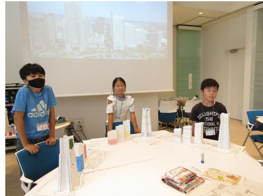
完成したペーパークラフトの前で記念撮影