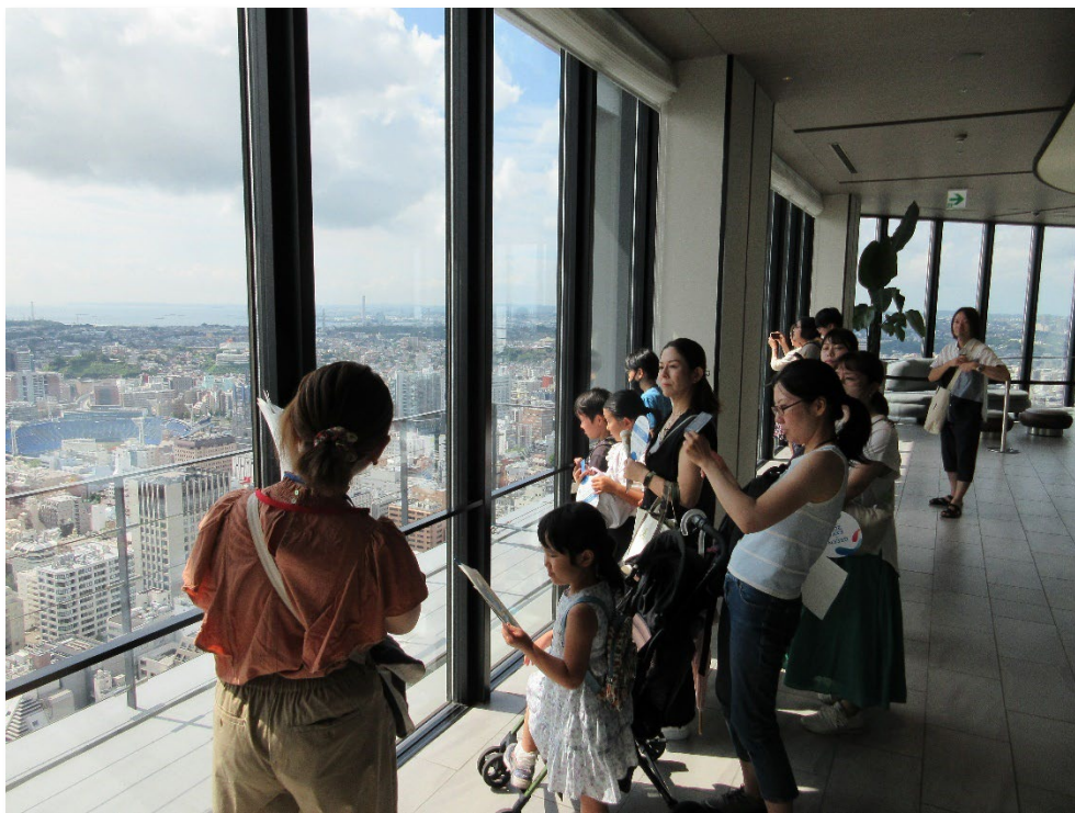
関内地区の説明を受ける子どもたち