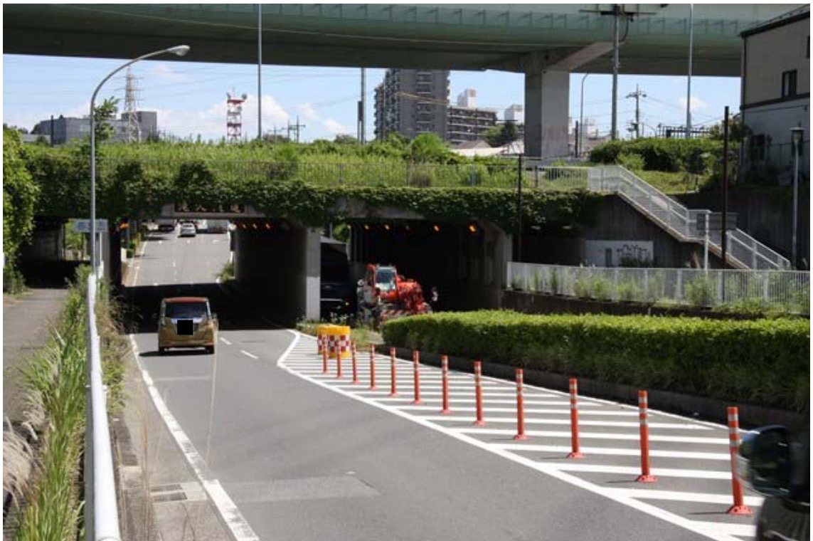
瀬谷区方面側から