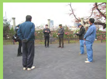
人との距離を保つ